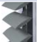
BS 100 LOUVRE - GRIPSYSTEEM