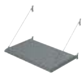
BS 100 VOORAF GEASSEMBLEERD KADERSYSTEEM