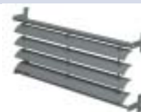
BS 20 KADERSYSTEEM