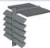
BS 100 VAST LOUVRE - SYSTEEM