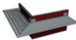
BS 30 KADERSYSTEEM