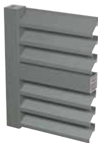
LAMELLES EN Z